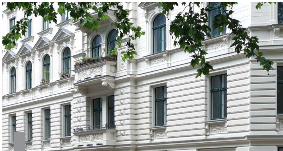
Steigende Preise und niedrige Zinsen könnten bald der Vergangenheit angehören. Ist es richtig, auf dem Höhepunkt der Preisentwicklung zu verkaufen?

Niemand konnte vorhersehen, dass der Immobilienboom so lange anhalten würde. Seit 13 Jahren wächst der bulwiengesa-Wohnimmobilienindex, aber erst seit Anfang 2017 tauchten verstärkt Zweifel auf, ob sich diese Entwicklung fortsetzt, ob sich die Märkte einpendeln, ob die Preise stagnieren werden oder eine heftige Korrektur droht. In seinem Frühjahrsgutachten 2017 warnte das Forschungsinstitut empirica vor einem Crash. Seit dem schauen alle ängstlich auf die Zinsentwicklung, die eine Wende auf dem Markt einläuten würde – aber bisher ist nichts geschehen. In Schweden sieht das derzeit schon ganz anders aus, auch in London brachen die Preise rapide ein. In Deutschland hat sich das Immobilienklima nur wenig verschlechtert. Derzeit halten sich die Argumente für Kauf, Verkauf oder Miete die Waage. Sichere Prognosen gibt es nicht. Immobilieninteressenten und -eigentümern ist daher zu raten, genau das zu tun, was im eigenen Lebensabschnitt jetzt ansteht, und sich nicht auf Spekulationen einzulassen.